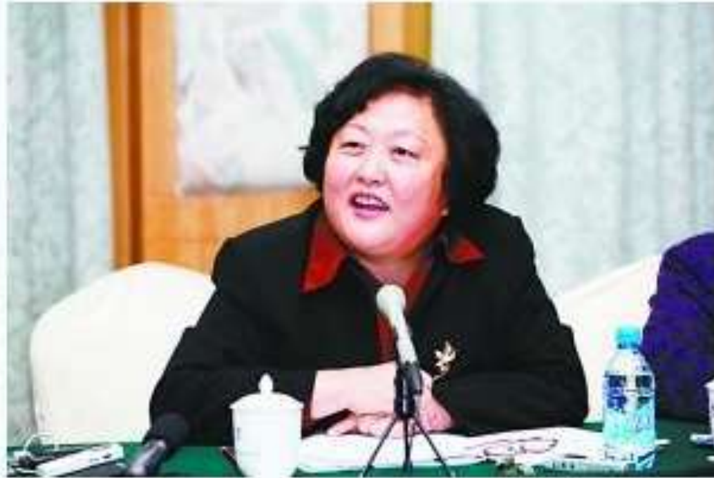
中国红十字会新任常务副会长赵白鸽。