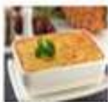
维多利亚肉酱焗饭