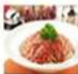
乐菲欧经典肉酱意面